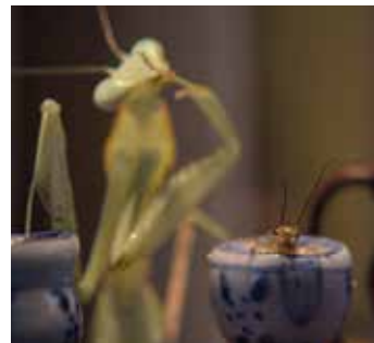
© M+M, VG Bild-Kunst, Bonn 2023